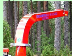
размеры горловины 285 x 165 mm