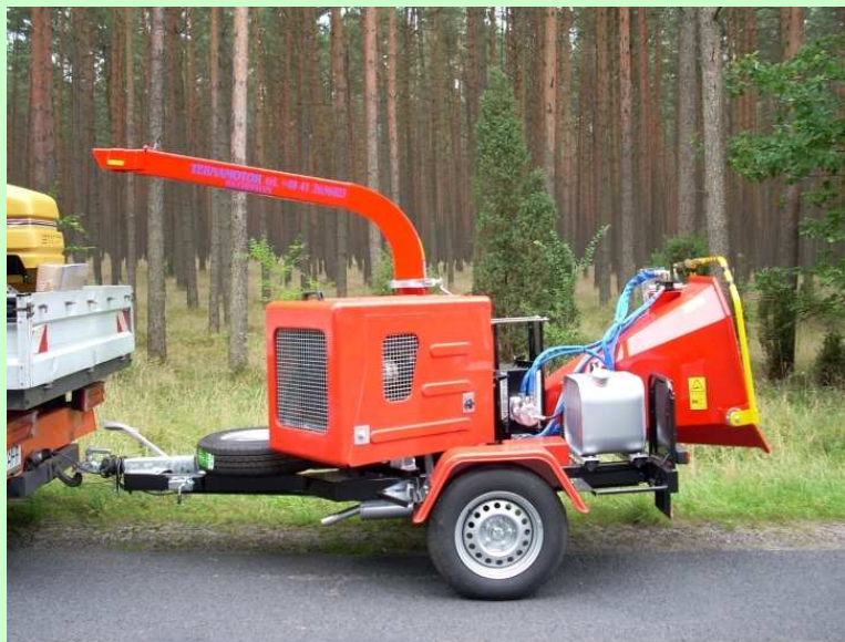
Skorpion 160 SD

Предназначенный для дробления ветвей диаметром до 160 мм. Имеет гидравлическую систему подающих роликов, которые самостоятельно втягивают в горловину ветви, что делает обслуживание устройства легким и простым. Гидравлическая система подачи увеличивает 3-4 кратно производительность через текучесть резьбы ветвей, что обеспечивает постоянную загрузку со скоростью 33 м/мин и производительность на уровне 16 м 3 /час. На диск ставятся двухсторонние ножи, что увеличивает рабочее время. Модель особенно рекомендована для работ очистки дорог и парков и на лесосеке. Преимуществом этой модели является возможность свободного передвижения.